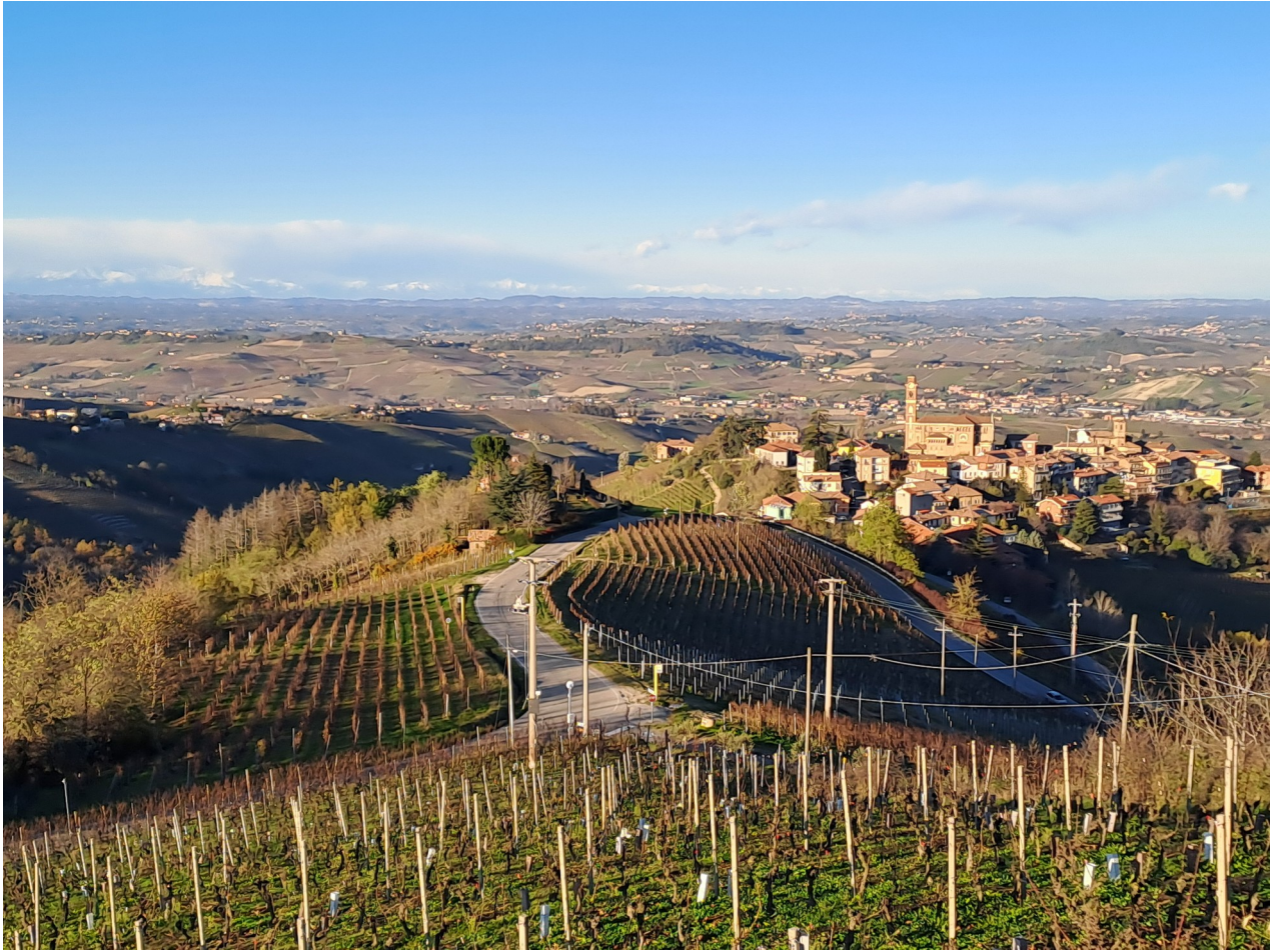
Paesaggio da Santo Stefano Belbo

Sulla strada del ritorno, spostandosi al confine fra Langhe e Monferrato, è consigliabile la visita di Trezzo Tinella , un minuscolo borgo incastonato tra i boschi, con una delle viste più belle sull'intero territorio, con lo scenario dell'anfiteatro delle catene montuose che si rincorrono tra Valle d'Aosta e Liguria. In paese sono interessanti anche la Parrocchiale di Sant'Antonio Abate, tipica costruzione neoclassica piemontese con volta a botte, e la Cappella di Sant'Anna ai Fiori.