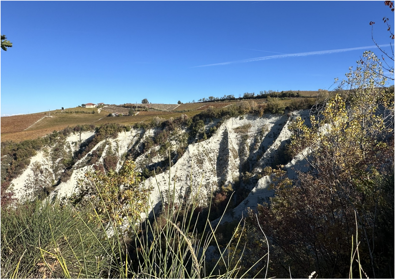
Rocca dei Sette Fratelli, fenomeno erosivo delle marne locali