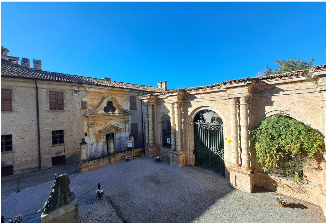
Complesso del Palazzo dei Conti di Castelborgo a Neive

Poco distante si trova il Palazzo dei Conti di Castelborgo , noto come "Castello di Neive". Questo bel palazzo settecentesco, composto da numerosi spazi, tra cui il giardino dei Conti di Castelborgo, venne costruito inglobando diversi edifici preesistenti. Oggi ospita un'azienda vinicola, ma conserva intatti gli ambienti barocchi di rappresentanza. Nelle cantine del palazzo sono stati eseguiti i primi esperimenti per la vinificazione del vitigno Nebbiolo, dando vita al celebre vino Barbaresco.