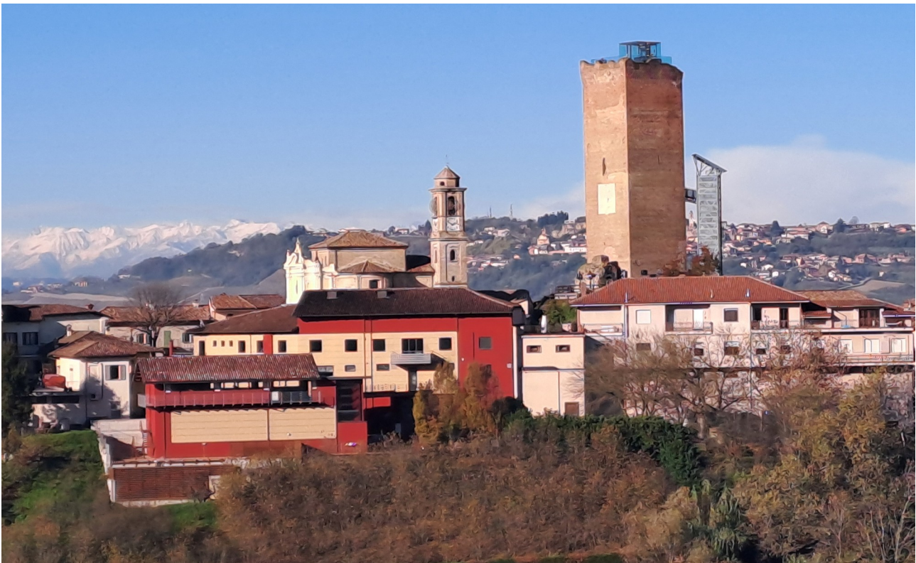
Barbaresco con la sua torre medievale

Sul versante affacciato sul Tanaro si possono ammirare bei calanchi e, come sospesa nel vuoto, appare la torre medievale dell'XI secolo, simbolo del paese, la più grande e massiccia del Piemonte, che domina l'antico borgo, caratterizzato dal tipico impianto urbano di età medievale con una via maestra, su cui si affacciano le numerose attività legate alla storica vocazione vitivinicola di questi luoghi. Rimasta per molto tempo un rudere, dopo un accurato restauro è ora visitabile e si propone come una delle attrazioni turistiche principali del territorio: da non perdere è la salita sulla cima, da cui si può apprezzare una vista eccezionale, magari degustando un calice dell'omonimo vino al bar ristoro della torre, con lo sguardo intento ad ammirare la vicina Valle Tanaro, il Roero e, nelle giornate limpide, anche le Alpi.