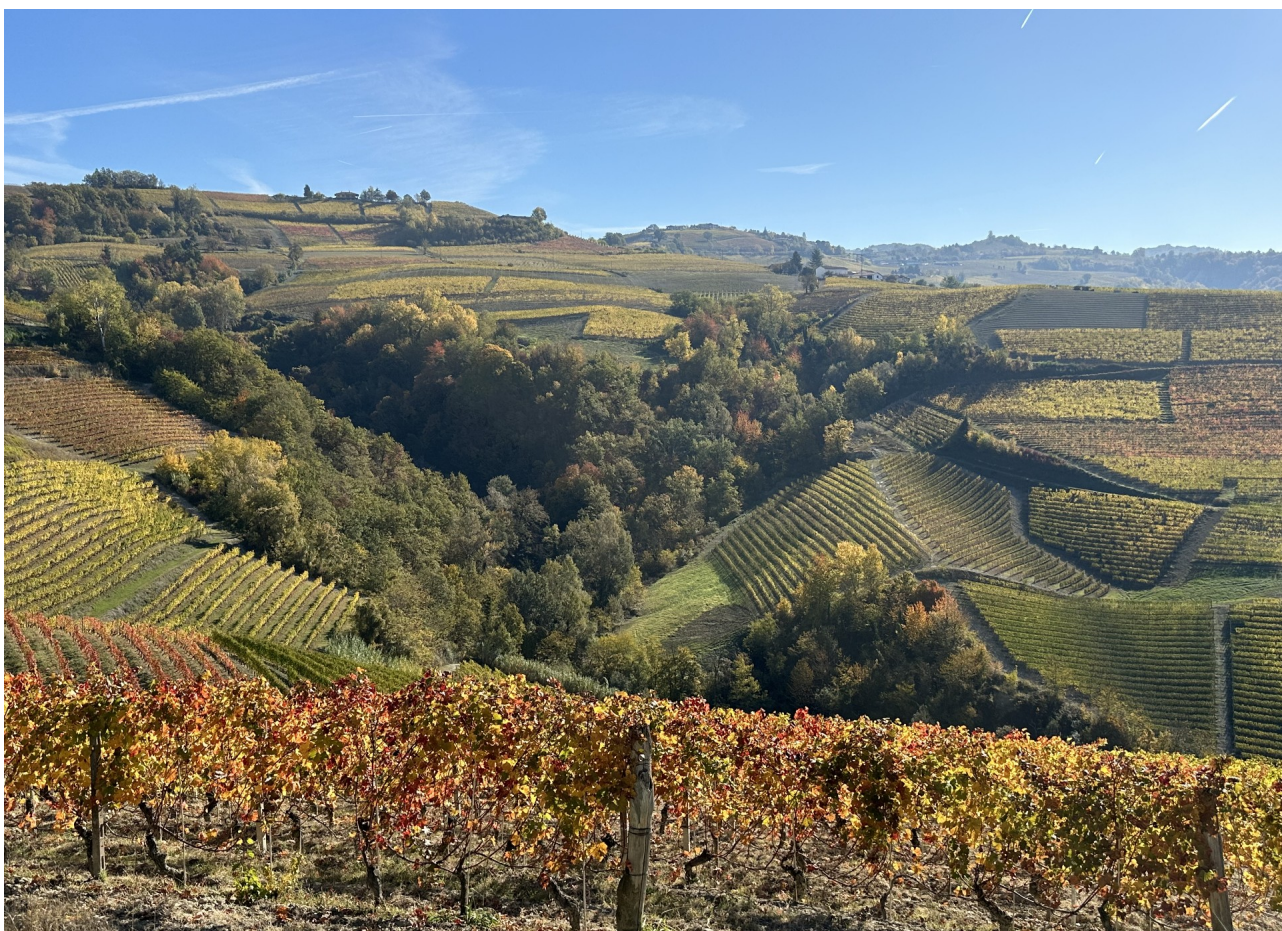
Vigneti eroici coi suggestivi colori autunnali nella zona del Barbaresco

Proseguendo, poco distante da Barbaresco verso Neive, si presentano altri panorami meravigliosi; si segnala ad esempio la Strada Romantica , costituita da 11 tappe, 130 km di strade panoramiche ricche di spunti letterari, e il trekking " Da Barbaresco a Neive ", una camminata tra i filari che segue parte del celebre e spettacolare percorso ciclo escursionistico " Bar to Bar ".