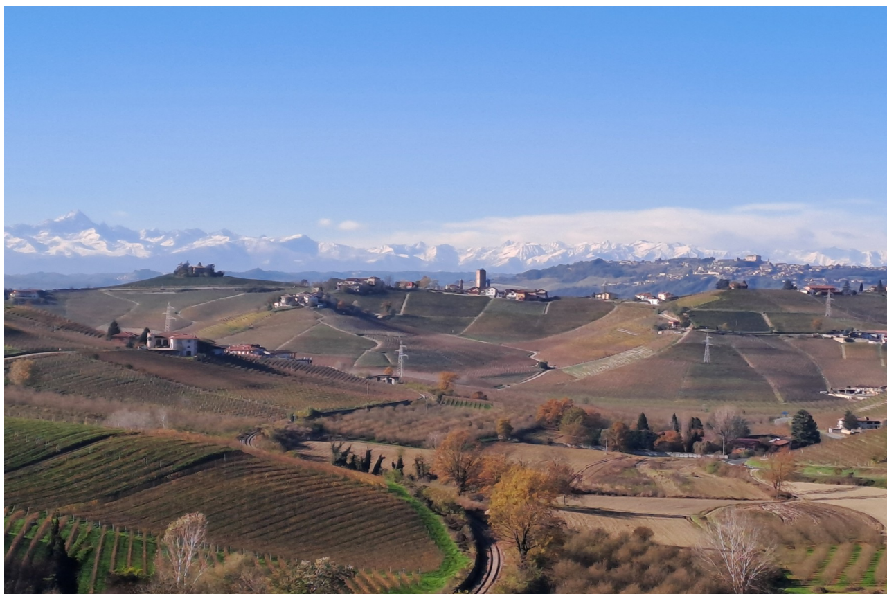
Il bucolico paesaggio delle Langhe del Barbaresco

Tra dolci colline e vigneti che si estendono a perdita d'occhio si trova la Langa del Barbaresco, una delle regioni vitivinicole più affascinanti e rinomate d'Italia. Questo territorio, patrimonio dell'Umanità UNESCO dal 2014, è famoso non solo per il suo vino pregiato, ma anche per la sua storia, la sua cultura e la bellezza dei suoi paesaggi.