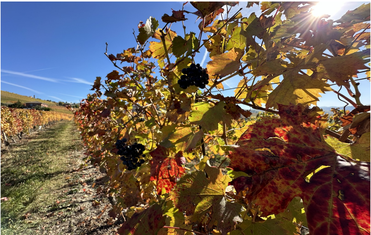
Le straordinarie e cangianti colorazioni dei vitigni

Dal punto di vista floristico, l'habitat delle praterie xeriche con orchidee è sicuramente il più diffuso: si segnalano alcuni siti importanti per la presenza di specie di orchidacee spontanee protette, come ad esempio il biotopo regionale o SIR Serra dei Pini, nel comune di Montelupo Albese, al confine tra le Langhe occidentali e orientali, una posizione che la rende un punto di osservazione ideale per entrambi i paesaggi.