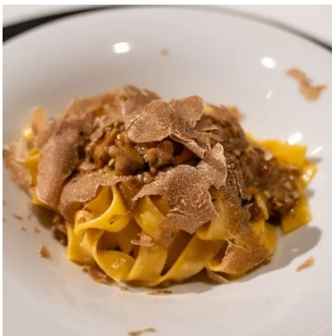
Tajarin al prezioso tartufo d'Alba, in un cooking show alla fiera del tartufo

Per entrare nel vivo delle usanze locali, è da provare anche la merenda sinoira , che un tempo si faceva in campagna nel cuore del pomeriggio, per recuperare le forze dopo i lavori svolti e prima di quelli della sera. La tradizione prevede che vi si trovino vitello tonnato, acciughe al verde, frittate, salumi e formaggi tipici di Langa, tra cui la Robiola di Roccaverano e di Murazzano.