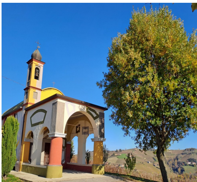
La chiesa dipinta da Tremlett a Coazzolo, con eccezionale vista panoramica sulle colline circostanti

Lasciandola alle spalle, si può salire a piedi lungo la strada sulla destra, per dirigersi alla Vigna dei pastelli , dove, al posto dei soliti pali, vengono impiegate delle suggestive, gigantesche matite colorate.