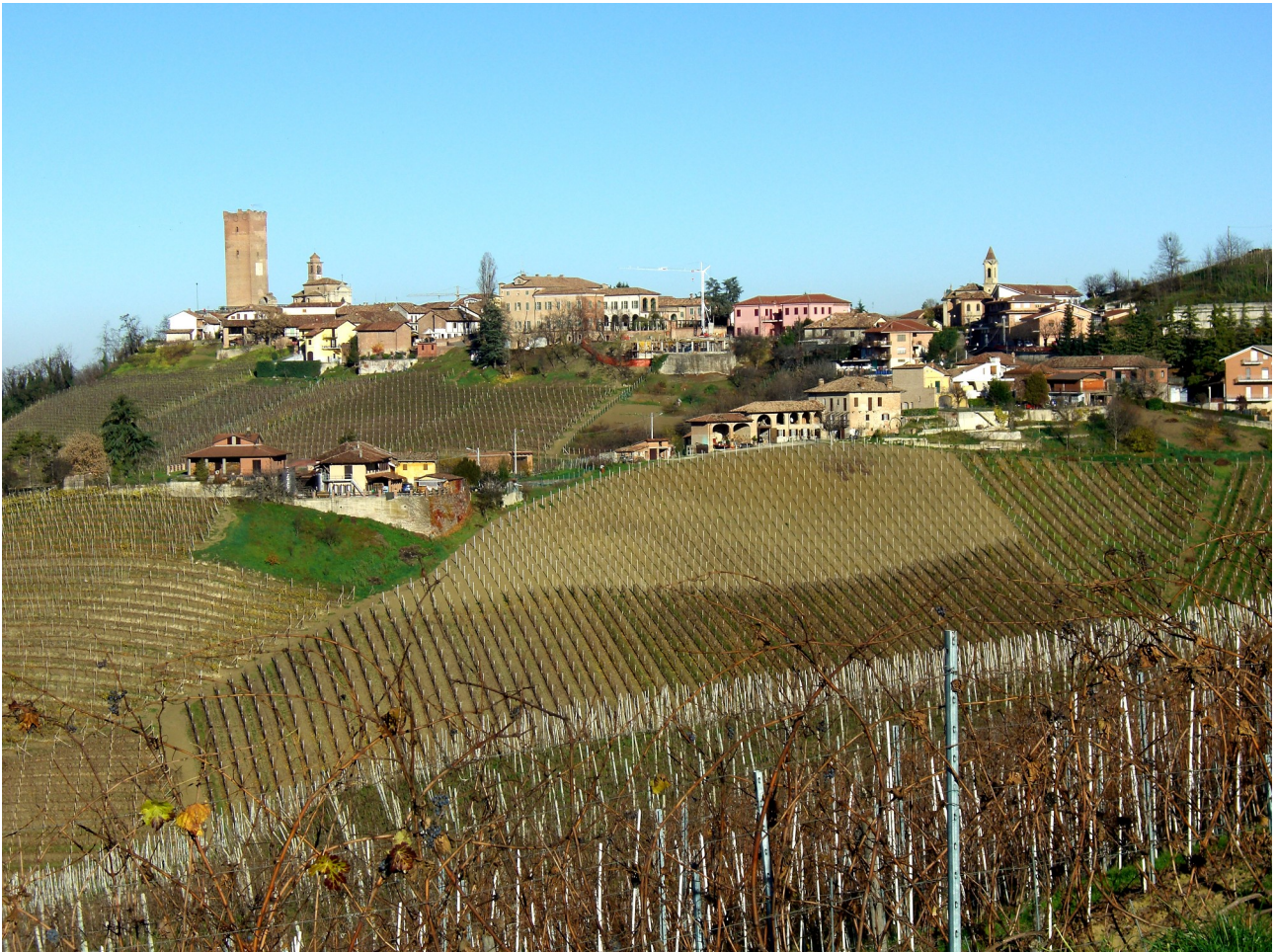
Vista da lontano del paese di Barbaresco a sinistra e vista sul paesaggio viticolo circostante

Qui, il vitigno nebbiolo viene trasformato da secoli nell'omonimo vino Barbaresco , ormai famoso in tutto il mondo, prodotto esclusivamente nei Comuni facenti parte della DOCG, ovvero Treiso, Barbaresco, Neive e San Rocco Seno d'Elvio , con terreni argillosi, calcarei o un misto tra i due e rigorosamente collinari; difatti sono esclusi i comuni di fondovalle o pianeggianti, in quanto troppo umidi o non sufficientemente soleggiati.