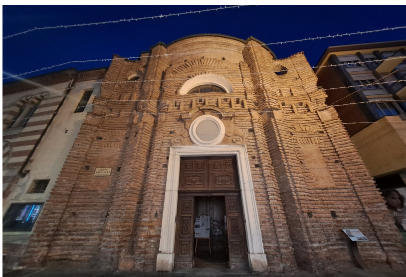
La bella facciata barocca della chiesa della Maddalena

All'incrocio tra via Vittorio Emanuele e via Paruzza sorge la chiesa della Maddalena , risalente alla metà del XVIII secolo. La facciata, le cui morbide linee ondulate ricordano altri edifici coevi, come Palazzo Carignano a Torino, si rifà allo stile barocco piemontese. La facciata, incompleta perché priva di rivestimento finale, è impreziosita da un portale ligneo su cui sono scolpite tre frecce incrociate, simbolo della Beata Margherita di Savoia. L'interno, anch'esso in stile barocco, è caratterizzato da otto colonne corinzie che si alternano ad alcune lesene e da una cupola con un lanternino.