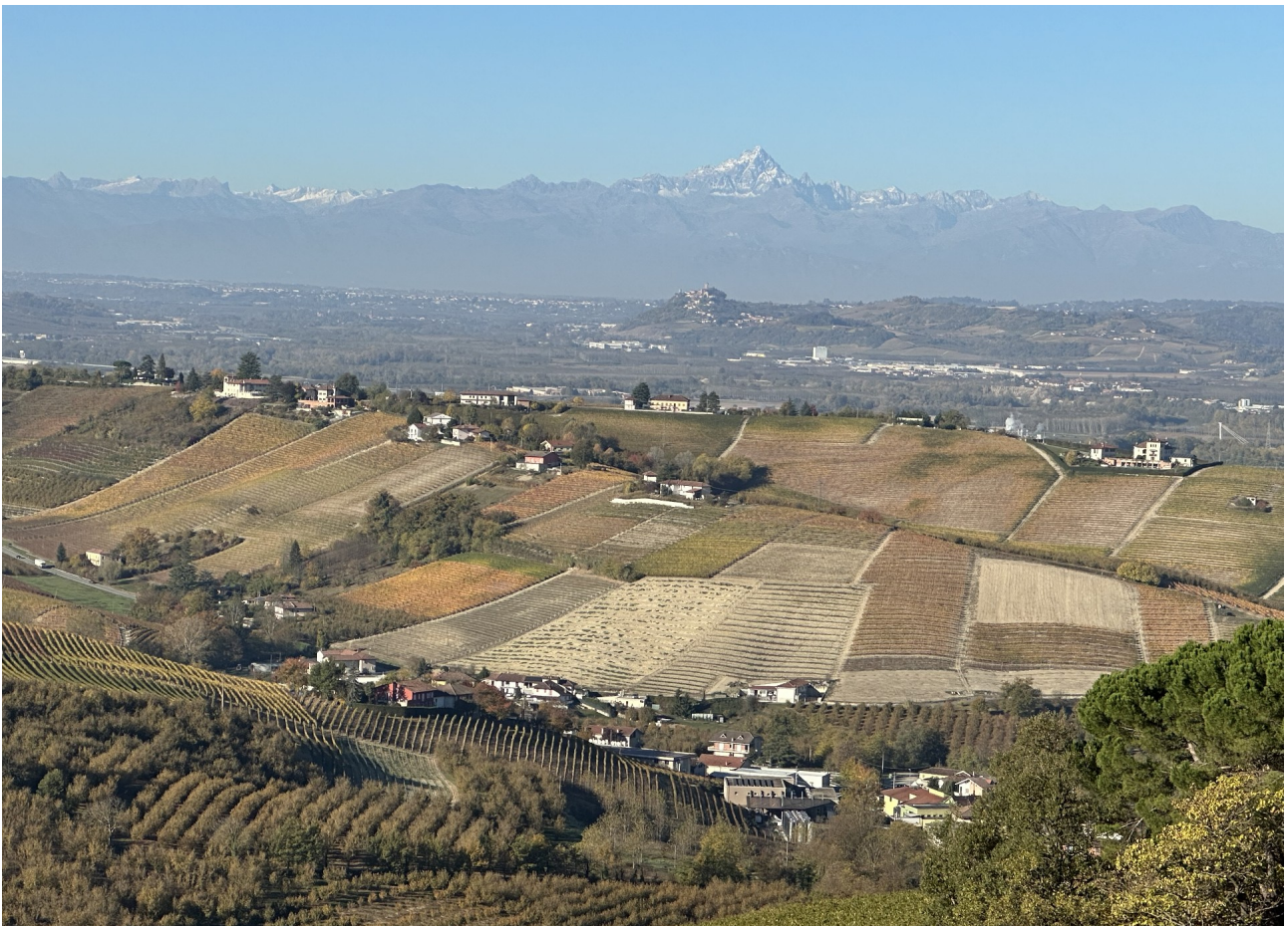
Paesaggi vitati verso Treiso

Giunti in paese, dalla piazzetta si gode uno straordinario panorama sulle colline vitate di Langa e Oltretanaro e sulla cerchia delle Alpi.