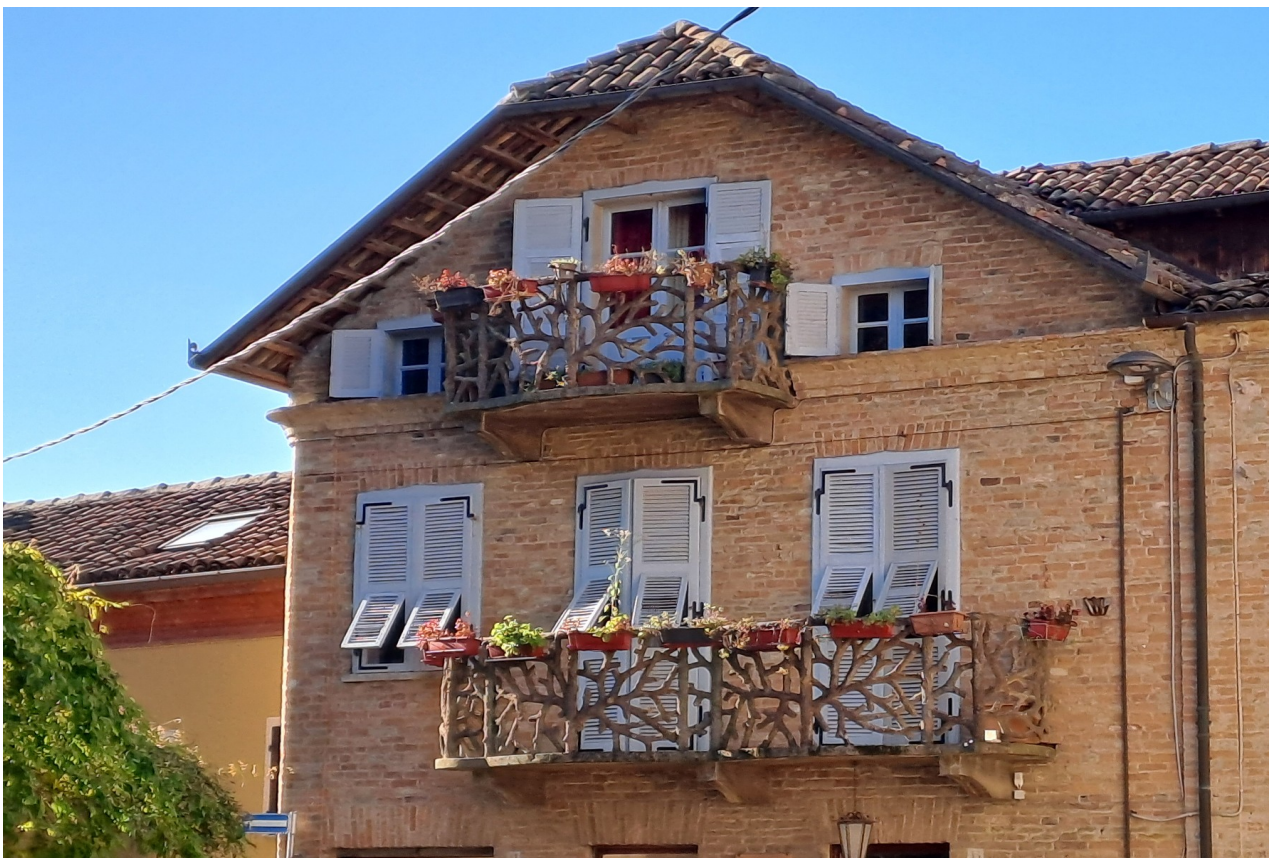
Uno scorcio del paese di Neive

Con le sue casette dai tetti rossi addossate le une alle altre entro un impianto urbano medievale, Neive offre alcuni degli scorci più suggestivi delle Langhe orientali, tanto da essere stato inserito nel 2001 nella lista dei Borghi più belli d'Italia e meritare la Bandiera Arancione del Touring Club .