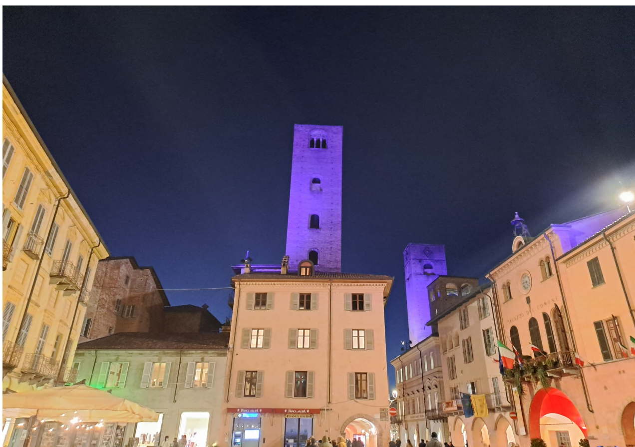
Suggestiva vista serale di alcune delle torri illuminate della città

Tra gli altri edifici religiosi, in via Accademia si trova la chiesa gotica di San Domenico , che risale al XIII secolo e pare sia stata usata in epoca napoleonica come stalla per i cavalli. Negli anni Settanta del Novecento, grazie a imponenti lavori di restauro, l’edificio è stato riportato agli antichi splendori e, nonostante vi si celebrino ancora riti liturgici, viene utilizzato in prevalenza per mostre ed eventi culturali.