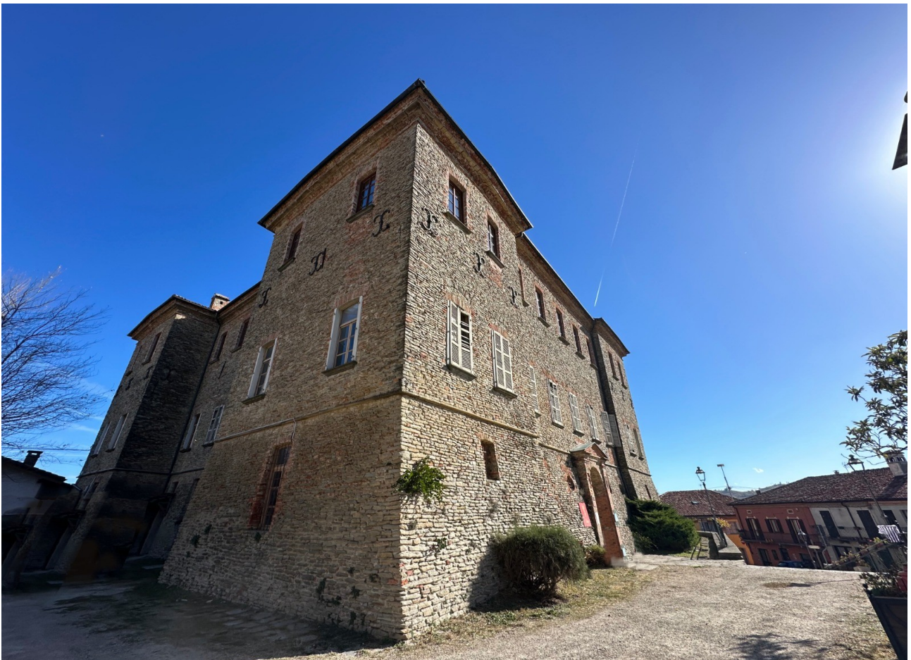
Castello di Mango, sede dell'Enoteca Regionale del Moscato d'Asti

Il maniero, dotato di camminamenti segreti che sbucavano in aperta campagna, prigioni e persino sale di tortura, fu costruito con funzioni strategiche sul finire del XIII secolo, dopo che l'esercito astigiano rase al suolo i preesistenti castelli di Frave, Vene e Vaglio per ritorsione nei confronti di Alba che, nel 1274, lo aveva umiliato battendolo in campo aperto a Cossano Belbo. Di quell'antico episodio resta memoria nello stemma comunale, che reca tre torri a emblema del passato. Il nome di Frave compare in parecchi documenti medievali ed era una località importante perché sotto le mura e le torri del maniero passava la Via Magistra Langarum , che da Alba, toccando Trezzo, Frave, Rocchetta Belbo, per Castino, Cortemilia, Scaletta e Cairo, conduceva alla riviera ligure.