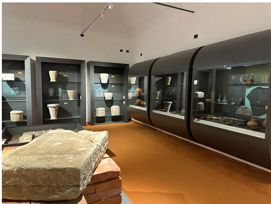
Numerosi reperti romani del tempo di Alba Pompeia (I – II sec. d.C.), conservati al Museo Civico Eusebio di Alba

Fondato nel 1897 per iniziativa di Federico Eusebio, alla cui memoria è oggi intitolato, il museo nacque esclusivamente come raccolta storico-archeologica, con importanti reperti risalenti al periodo neolitico, rinvenuti in alcuni scavi presso Alba, nonché un'importante sezione di storia romana.