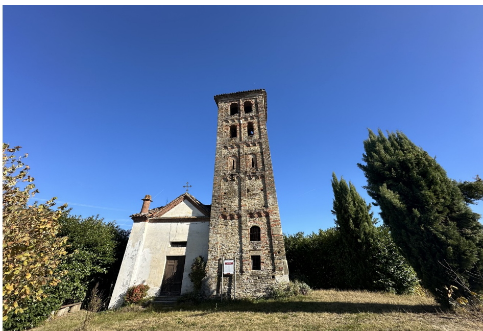
Chiesa di Santa Maria del Piano col suo bel campanile romanico

Proseguendo il percorso in auto, uscendo dall'abitato lungo il torrente Tinella e la strada panoramica per Mango, è consigliabile una tappa per ammirare uno dei più interessanti campanili romanici del Piemonte, che, svettando nel mezzo della campagna, annuncia la suggestiva Chiesa benedettina di Santa Maria del Piano , un luogo di pace e bellezza.