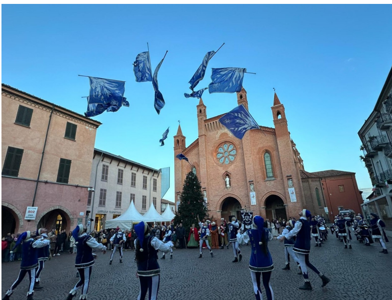
Sbandieratori in costume d’epoca nella piazza del Duomo

Dal XIV al XVII secolo, Alba fece parte del Marchesato del Monferrato, vivendo un periodo di conflitti tra gli eserciti francesi e spagnoli. Solo con la Pace di Cateau-Cambrésis nel 1559, la città conobbe un periodo di relativa stabilità sotto il dominio dei Gonzaga; tuttavia, nel 1613, Alba fu assediata da Carlo Emanuele I di Savoia, che la conquistò nel 1628.