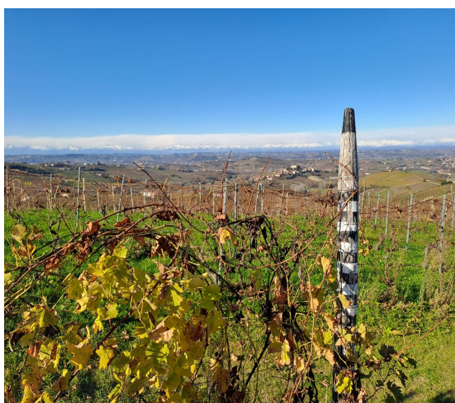
La vigna con i pali a forma di pastelli a Coazzolo

Per concludere la visita della zona con un'escursione letteraria, si prosegue sino a Santo Stefano Belbo , il paese natale di Cesare Pavese , celeberrimo autore di capolavori come "La luna e i falò".