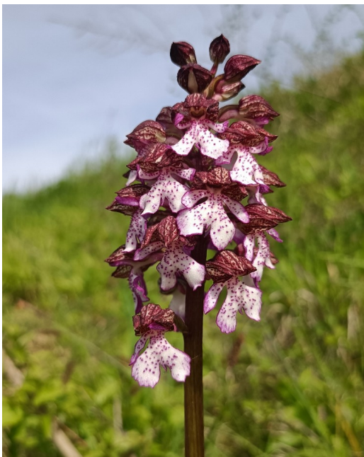
Orchidee selvatiche: Orchis purpurea

Dal punto di vista floristico, l'habitat delle praterie xeriche con orchidee è sicuramente il più diffuso: si segnalano alcuni siti importanti per la presenza di specie di orchidacee spontanee protette, come ad esempio il biotopo regionale o SIR Serra dei Pini, nel comune di Montelupo Albese, al confine tra le Langhe occidentali e orientali, una posizione che la rende un punto di osservazione ideale per entrambi i paesaggi.