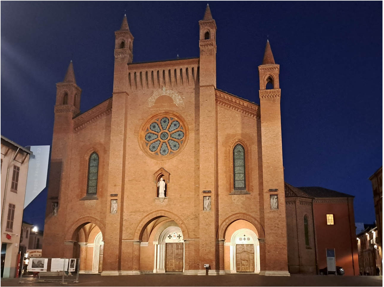
Il Duomo di San Lorenzo di sera

Non lontano dal centro storico, in via Alessandro Manzoni, si trova la chiesa di San Giuseppe , edificata per volere della Confraternita dei Pellegrini; la facciata non è appariscente, ma l'interno stupisce per le ricche decorazioni in stile barocco ed è da ammirare la volta, ornata da un ciclo di affreschi realizzati tra il 1720 e il 1721, la statua lignea di San Giuseppe, l'organo settecentesco fabbricato dai fratelli Concone di Torino e gli scavi archeologici che attraversano l'edificio. All'esterno, è possibile salire sul campanile realizzato in tipici mattoni rossi. La chiesa spesso ospita anche mostre ed eventi, in particolare nel periodo natalizio, con l'esposizione dei presepi.