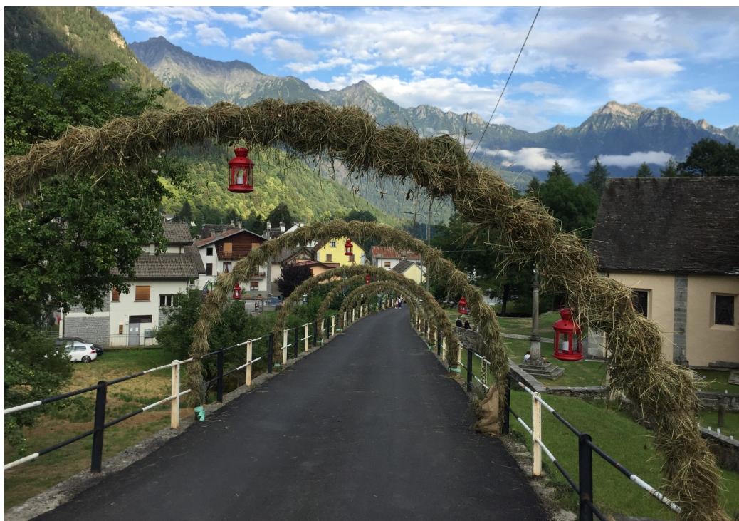
Il paese di Croveo addobbato a festa