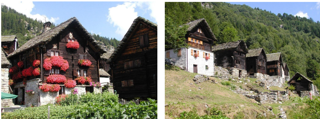
Le caratteristiche case walser dei villaggi di Salecchio

Partendo da Premia, si consiglia anche una piacevole escursione nelle splendide località di Salecchio Inferiore (1.320 metri) e Superiore (1.510 metri), due antichi villaggi walser , affascinanti sia per la loro posizione che per la loro particolare storia quasi millenaria.