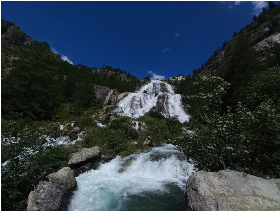
Una veduta panoramica del Fiume Toce e della sua omonima cascata

Se si pensa alla sagoma della foglia d'acero – simbolo dell'Ossola, in quanto richiama il disegno delle sue valli laterali che confluiscono in quella principale – si può collocare la Valle Antigorio nel lobo maggiore, lungo la nervatura centrale incisa dal corso del fiume Toce, in direzione Nord-Sud.