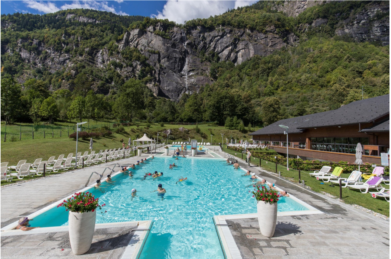
La splendida posizione panoramica dello stabilimento termale di Premia