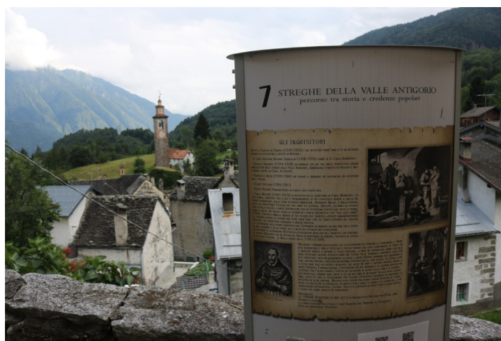
Vista dall’alto del borgo antico di Croveo con i totem multimediali che raccontano delle streghe