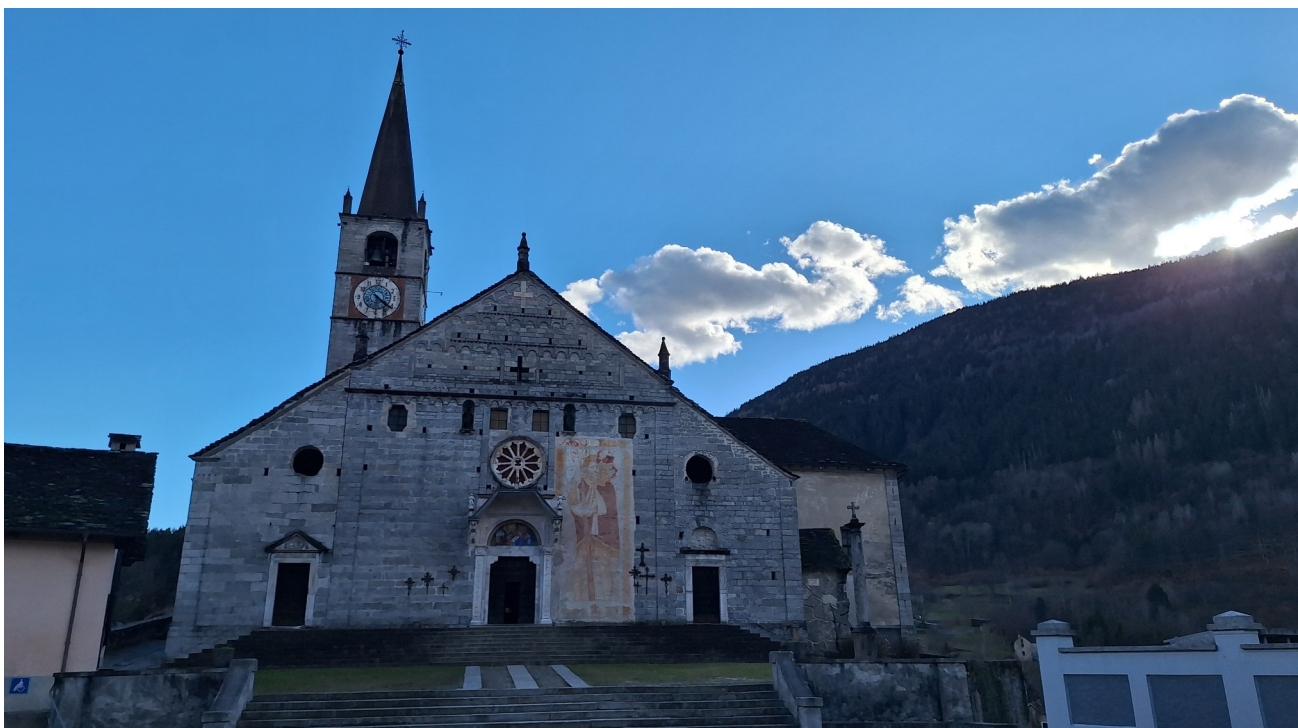
La Chiesa monumentale di San Gaudenzio a Baceno

Lasciata Crodo, si raggiunge Baceno , che sorprende con la straordinaria Chiesa monumentale di San Gaudenzio , che lo scrittore Piero Chiara reputò essere "la più bella delle Alpi". La chiesa fu eretta nel X secolo sullo sperone roccioso che domina l'orrido di Silogno e più volte ampliata nei secoli successivi. L'interno è riccamente decorato da pregevoli affreschi, mentre sulla facciata, in stile romanico lombardo, spicca il grande dipinto di San Cristoforo, patrono dei mercanti che valicavano la Bocchetta d'Arbola, storica via di comunicazione con la svizzera Valle di Binn.