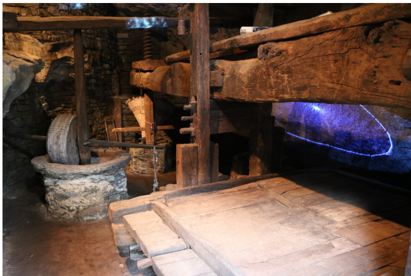
Antico torchio a leva per la spremitura dell'uva, nel cuore del borgo

Sempre nella frazione, si può ammirare un antico torchio a leva per la spremitura dell'uva, un'importante testimonianza della tradizione vinicola locale, che aveva però anche un altro impiego. Costituito da una trave di otto metri di lunghezza e una macina, era usato anche per la macinazione di prodotti come canapa, noci, uva, mele e soprattutto pere; quest'ultime, dopo essere state frantumate nella macina e pressate, permettevano di ottenere una bevanda chiamata "vign at pir".