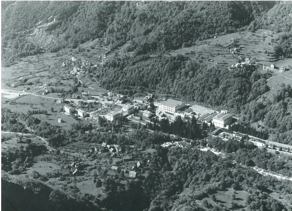
Stabilimento e Parco termale di Crodo negli anni Sessanta

mondo, il Crodino: un tempo infatti qui sorgeva un importante stabilimento per la produzione di acqua minerale e bibite, vicino al verde Parco delle Terme.