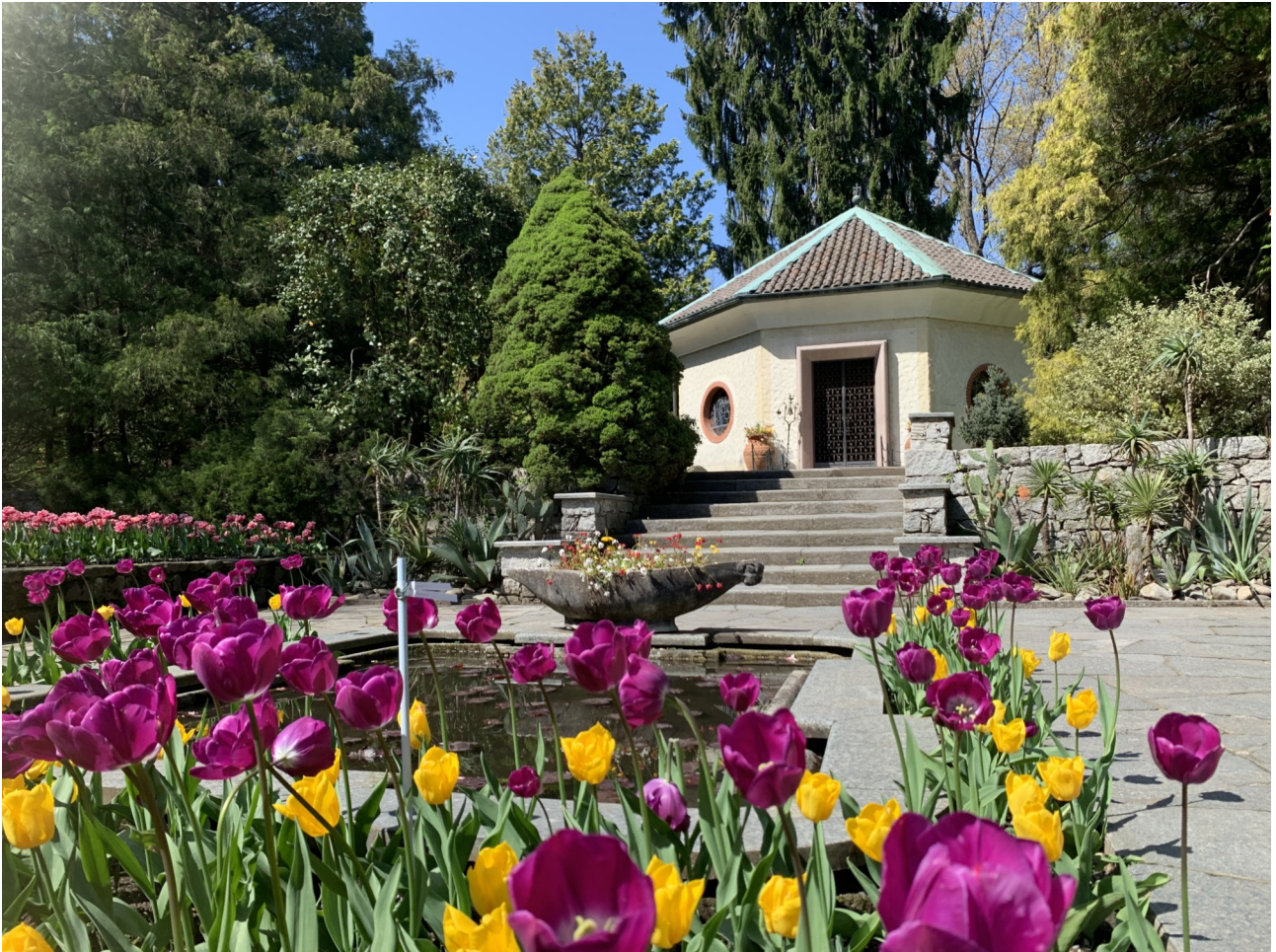
Il Mausoleo contenente le spoglie del Capitano Mc Eacharn

Poco dopo si arriva al punto 4 , dove si trova la Cappella Mausoleo , costruita nel 1965 su disegno del professor Renato Bonazzi, per esaudire un desiderio del defunto che aveva chiesto di riposare nel giardino che fu la sua "ragione di vita". Mirabili sono le vetrate policrome, opera di Paolo Rivetta (1911-1993), che raffigurano fiori e nel centro l'immagine di Sant'Antonio da Padova, cui è dedicata la cappella.