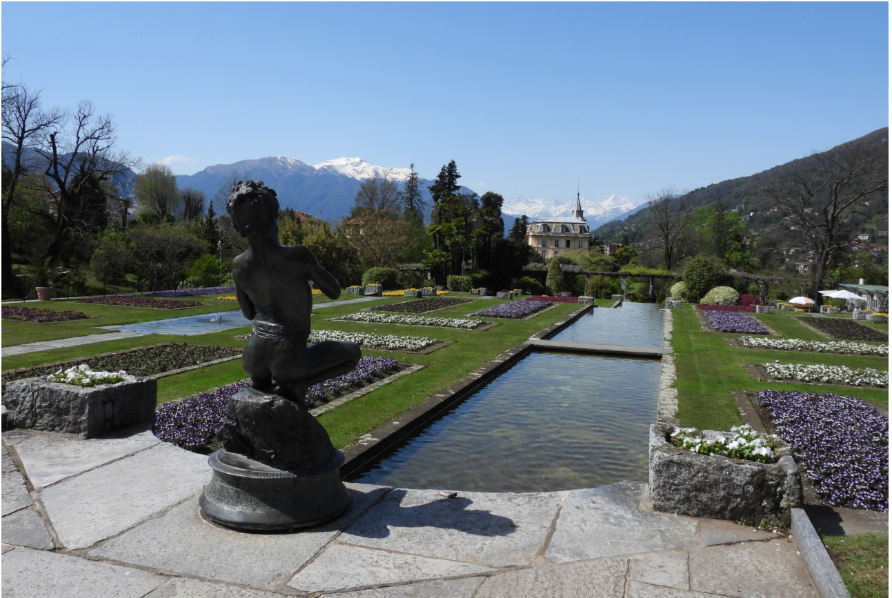
La statua del pescatore, a monte dei Giardini terrazzati

Negli anni il Giardino non è stato risparmiato dai cambiamenti climatici e fortuali di forte intensità: per esempio, il 25 agosto 2012 una tromba d'aria distrusse circa 600 piante, un disastro che provocò la chiusura anticipata della struttura, ma, nonostante i danni rilevanti, fu ripristinato a tempo di record e riaperto per l'apertura stagionale del 2013.