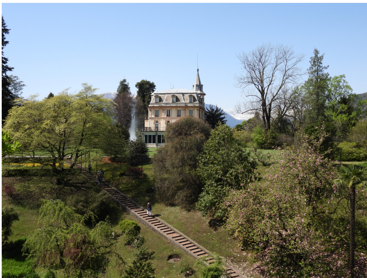
Uno scorcio del giardino di Villa Taranto

Spesso viene definito come uno dei giardini botanici più belli al mondo: questo elogio spetta al giardino botanico piemontese di Villa Taranto , situato sul lago Maggiore, nella parte Nord-orientale del promontorio della Castagnola, tra le frazioni cittadine di Pallanza e Intra.