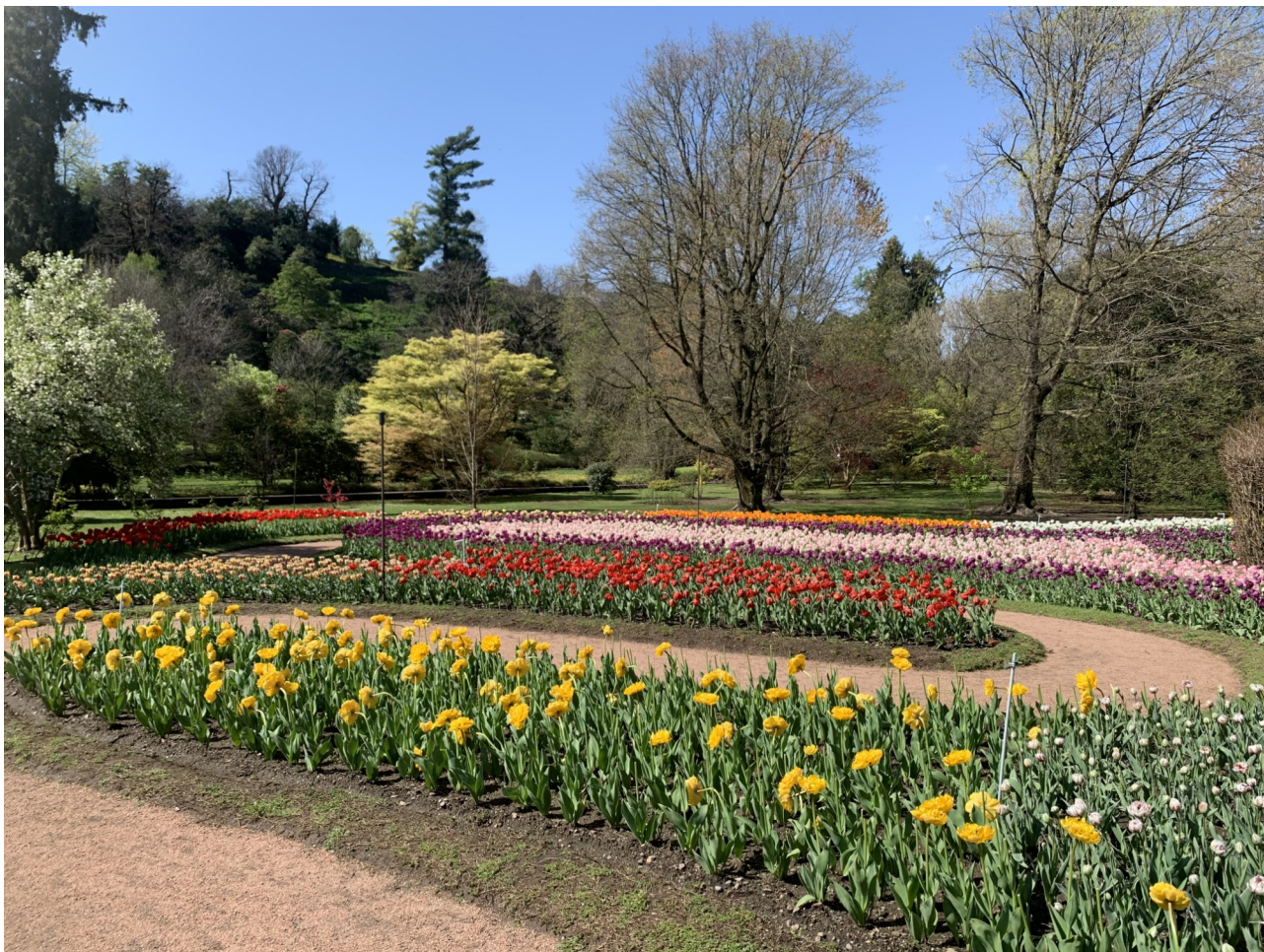
Il labirinto dei tulipani nel mese di aprile

Procedendo, poco dopo si arriva al punto 2 , uno dei più gettonati del giardino, il famoso Labirinto dei tulipani e delle dalie , che a inizio primavera, ad aprile, sembra un quadro naïf, tingendosi di tutti i colori dal rosso al bianco, dal viola al giallo delle più di 60 varietà di tulipani in fiore, mentre dall'estate all'autunno lo stesso risorge e incanta i visitatori con lo spettacolo di oltre 1.700 dalie in fioritura, che vengono piantumate nella prima decade di maggio. Tra le 350 varietà, spiccano le decorative a fiore grande e le pompons , i cui capolini sferici a nido d'ape invece non raggiungono i 5 mm di diametro, e l'appariscente Emery Paul , dall'intenso colore rosso granata.