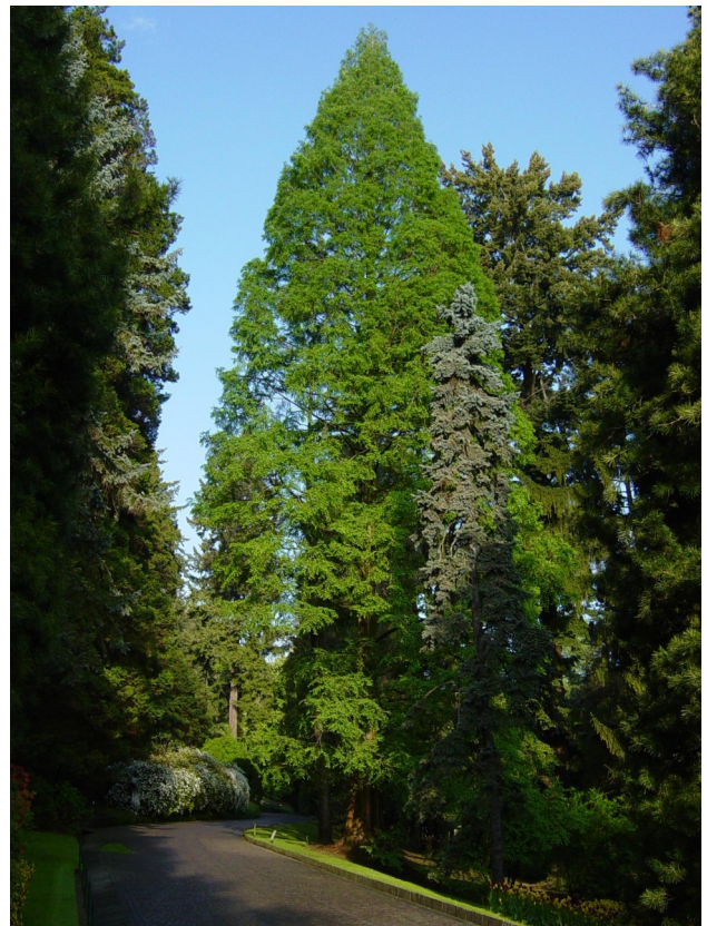
Il Viale delle Conifere con le varipinte bordure floreali e la rara Metasequoia e, a sinistra, la Fontana dei putti

Di fronte, troviamo un'altra specie rara, l'elegante Dicksonia antarctica , appartenente alla grande famiglia delle felci e in particolare al gruppo delle "felci arboree" per il caratteristico "tronco". Originaria delle foreste umide dell'Australia, è presente nel parco con oltre 30 esemplari.