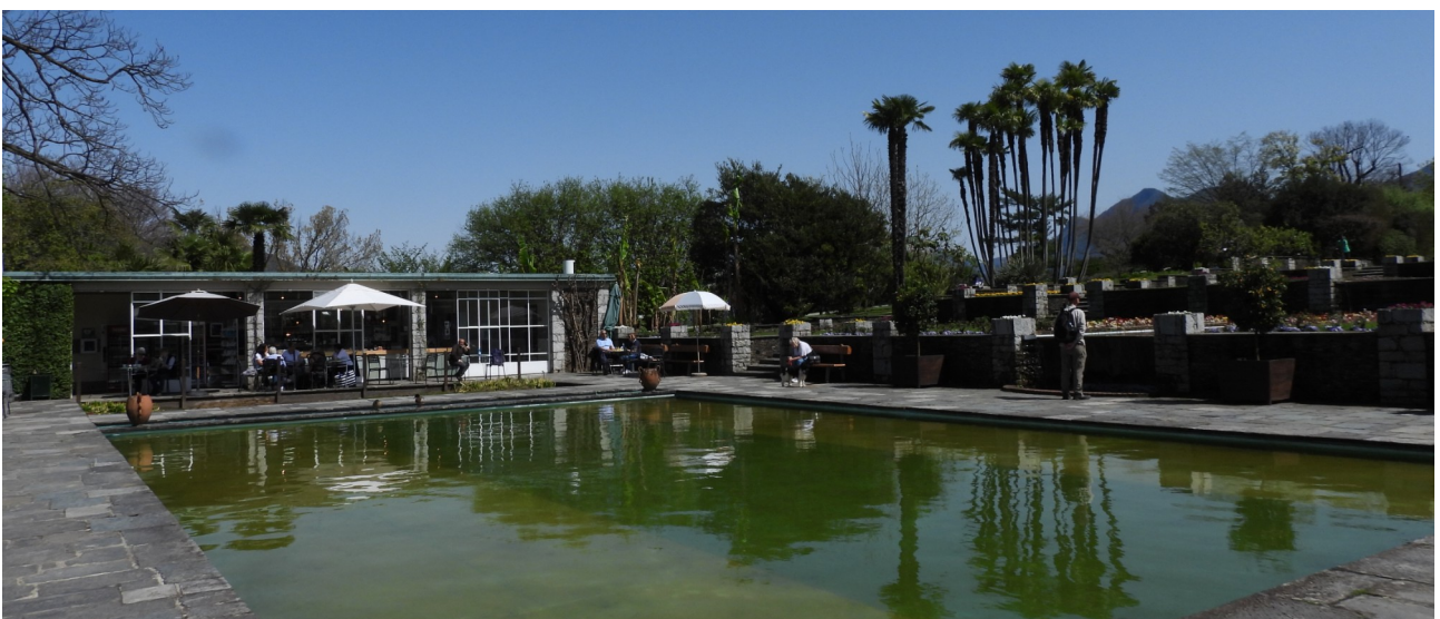
La piscina con bar ristoro e l'inizio dei Giardini terrazzati

Salendo ancora la scalinata, nella parte più alta, al punto 8 , si trovano i Giardini terrazzati , all'italiana, eleganti e variopinti, da cui si gode una meravigliosa vista sulle Alpi Pennine. Qui, statue, fontane, specchi d'acqua, cascatelle incantano e creano suggestioni che rinfrancano la mente e il corpo.