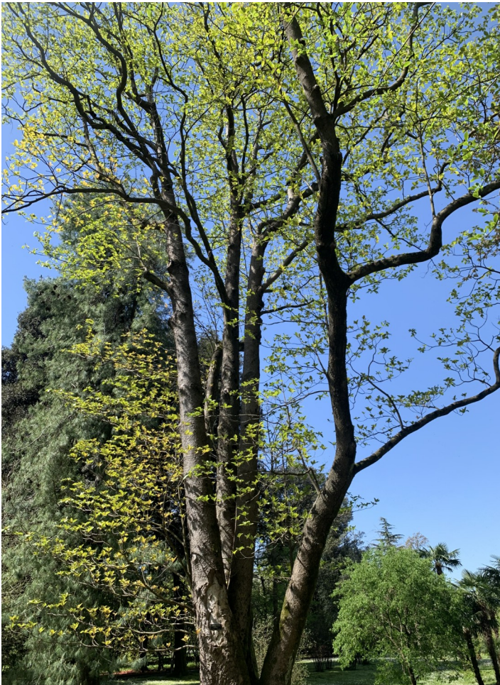
Una delle tante specie arboree rare, l' Emmenopterys henryi

Proseguendo, poco dopo si può notare anche l' Emmenopterys henryi , un albero appartenente alla famiglia Rubiaceae, la stessa del caffè, originario delle foreste temperate della Cina, dalle quali fu introdotto con successo in Europa nel 1907. Fu piantato in questi Giardini nel 1947, ma si dovette attendere fino al luglio 1971 per avere la sua prima fioritura; fu un evento straordinario, mai verificatosi prima di allora in Europa.