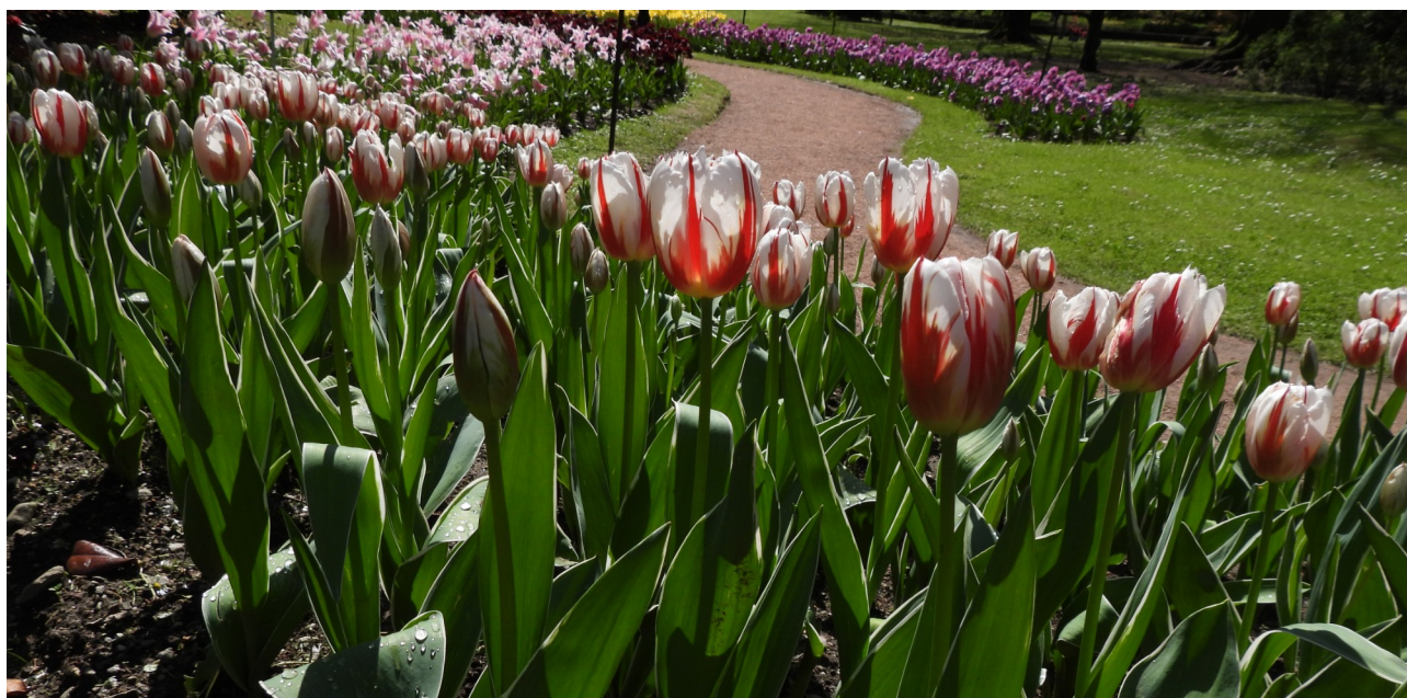
Tra le bulbose del Giardino, molti tulipani multicolori

Attualmente, il giardino fa parte delle rete dei Grandi Giardini Italiani ed è gestito privatamente dall'Ente giardini botanici Villa Taranto, che lo mantiene esclusivamente grazie agli ingressi dei visitatori, col preciso scopo di conservare questo impareggiabile gioiello di botanica e di bellezze naturali.