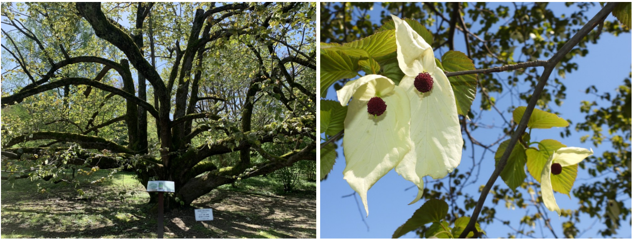
L'albero dei fazzoletti con le tipiche infiorescenze

Una di queste è un meraviglioso esemplare di Davidia involucrata , l'elegante albero dei fazzoletti o "albero delle colombe", originario della Cina, con le sue curiose e appariscenti infiorescenze, ampie brattee floreali bianche e svolazzanti al vento, che sembrano fazzoletti. Fu messo a dimora nel 1938 dall'infante di Spagna Don Jaime, ma ormai ha assunto dimensioni tali e un portamento talmente caratteristico, con i rami inferiori a mo' di braccio aperto, da costituire motivo di interesse anche in assenza delle spettacolari fioriture, tanto da fargli meritare un posto nel registro degli alberi monumentali della Regione Piemonte.