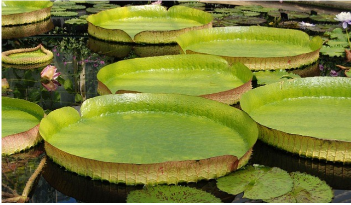
L'enorme ninfea equatoriale Victoria cruziana

Sullo sfondo della serra è possibile ammirare anche il Giardino Verticale, una struttura ricoperta da essenze vegetali che sono fatte radicare su pannelli di materiale fibroso.