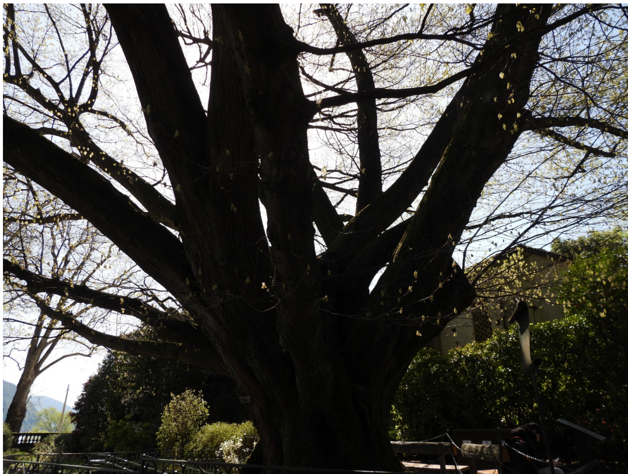
Il possente tronco di quercia rossa americana

All'ingresso, subito a sinistra della biglietteria, a dare il benvenuto si trova un esemplare monumentale di quercia rossa americana , Quercus coccinea Münchh, iscritta nel registro degli alberi monumentali della Regione Piemonte . Specie originaria della parte centro-orientale del Nord America, vi forma boschi misti di latifoglie su suoli acidi, poco profondi e asciutti. In Europa fu introdotta nel Settecento come albero ornamentale di parchi e alberate cittadine e in autunno, infatti, si possono ammirare le grandi foglie che si accendono di un bel colore rosso intenso.