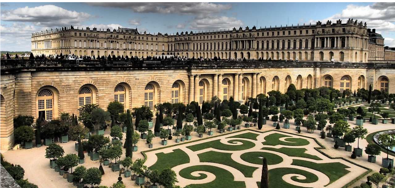
L'imponente orangerie della Reggia di Versailles

Non si può non citare la celeberrima orangerie della reggia di Versailles , della metà del XVII secolo, dove pare che, ai tempi di Luigi XIV, 600 alberi d'arancio in vasi d'argento ornassero la Galleria degli specchi e 3.000 alberi venissero disposti nei giardini.