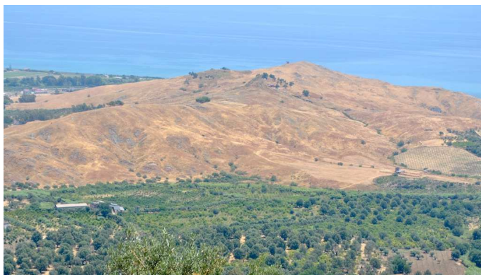
La piana del Bergamotto in Calabria

In Calabria si trovano altri due paesaggi storici di agrumi: la piana del Bergamotto , di circa 1082 ettari, posta nei comuni di Brancaleone, Bruzzano Zeffirio e Staiti, che rappresenta l'unica area al mondo coltivata a bergamotto, un agrume alto fra i 3 e i 4 metri. La prima piantagione di bergamotto fu opera nel 1750 del proprietario Nicola Parisi a Reggio Calabria, ma la fortuna dell'essenza si deve a Gian Paolo Feminis che, emigrato a Colonia nel 1680, formulò l' aqua admirabilis utilizzando l'olio estratto manualmente, pressando la scorza del frutto e facendola assorbire da spugne naturali; da allora, il bergamotto resta uno dei grandi prodotti basilari per la realizzazione di molti profumi. Il paesaggio del bergamotto mantiene la peculiarità tipica del "giardino di agrumi" ottocentesco, con un sesto d'impianto regolare.