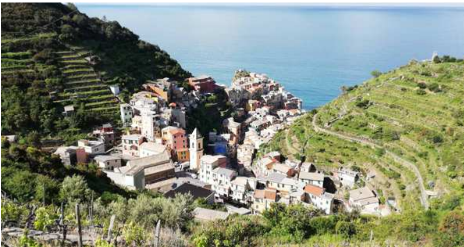
Il paesaggio di coltivazioni terrazzate a Manarola in Liguria

Salendo decisamente, anche gli agrumeti liguri sono tra i paesaggi a più alta valenza ecologico-ambientale in Italia e rappresentano la trasformazione del "giardino mediterraneo" in paesaggio agrario in terre privilegiate del Nord, seppure a prezzo di onerose sistemazioni agricole. Limoni, aranci amari e cedri disposti su terrazze dai muri contigui, ma anche sistemazioni come lunette o gradoni assieme ai muri di cinta, disegnavano in passato una straordinaria continuità di ordinate coltivazioni tra "giardini" e paesaggio naturale delle acclivi e accidentate colline costiere, un paesaggio agrario dalla ricca biodiversità coltivata. Visto dal mare, questo paesaggio fortemente antropico e costruito era un tutt'uno dilatato di orti-giardini, terrazzamenti, strade, borghi e coltivi, a testimoniare l'abilità dell'uomo contadino come architetto e manutentore del paesaggio. Tuttavia dei paesaggi agrumati della Liguria ben poco è sopravvissuto e i più recenti dati del censimento dell'agricoltura rilevano poco più di 50 ettari, risultato di una perdita del 62% negli ultimi 10 anni.