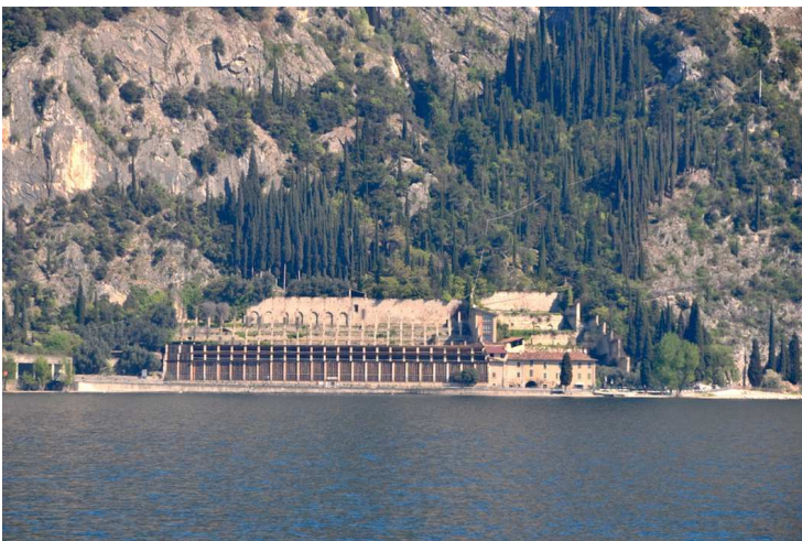
Le limonaie sul lago di Garda

Tuttavia, in tutti i contesti descritti, in maggiore o minore arretramento, gli agrumi italiani hanno comunque mantenuto, fin dalle origini del loro insediamento e dei paesaggi che hanno creato, una certa supremazia, che si deve non tanto alla loro esigua produttività, quanto alla loro irripetibile qualità. La salvaguardia e la promozione della tipicità del prodotto italiano, come frutto sia fresco sia trasformato, nella sua lunga ed esclusiva tradizione, si pongono oggi alla base della conservazione di un paesaggio che possa essere anche funzionale e competitivo .