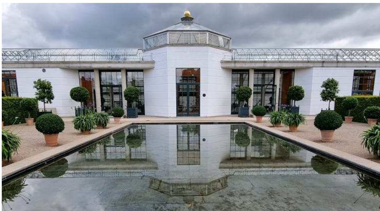
La moderna orangerie della residenza della famiglia reale danese a Fredensborg

Tale fenomeno si verificò non solo nell’area mediterranea, dove il clima è congeniale a queste specie, ma, a partire dal XVII-XVIII secolo, esse cominciarono a rappresentare elementi fondamentali della struttura dei giardini barocchi anche nel Nord Europa , dove il clima era ostile e le estati brevi. Qui, sfidando le temperature rigide, vennero fatte costruire strutture protettive di varia fattura e magnificenza per adornare i giardini di ville e dimore principesche, allo scopo di godere un po’ della bellezza del paesaggio mediterraneo. Nacquero così le orangeries (arancere), ricoveri per l’inverno, dai quali le piante venivano portate fuori nella bella stagione ed esibite nei giardini dei palazzi nobiliari. Ne furono costruite a centinaia: molte conservano ancora la loro struttura e funzione, e se ne possono ammirare meravigliosi esempi in Germania, Belgio, Francia, Svizzera, Austria e perfino Scandinavia.