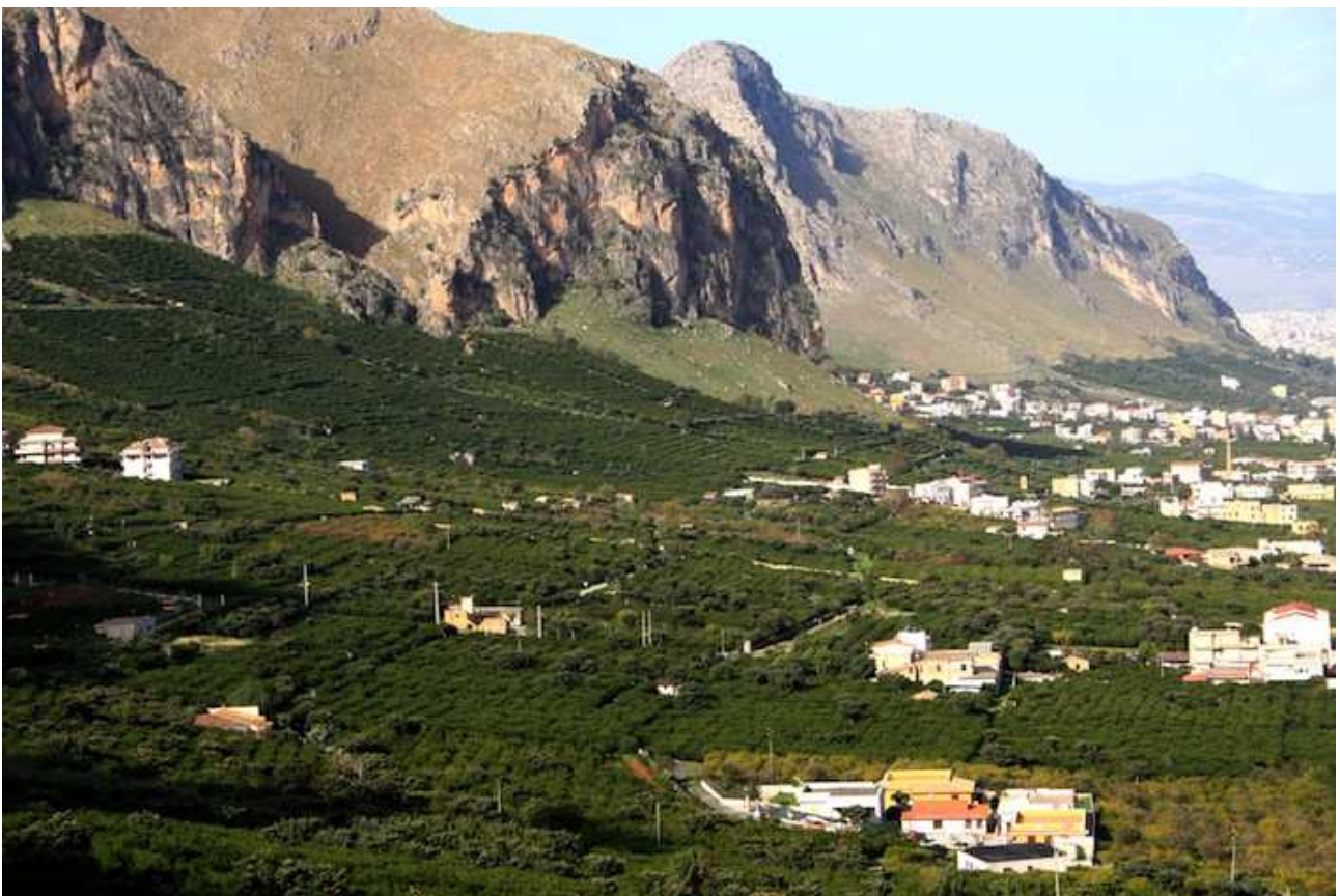
Gli agrumeti della Conca d'Oro in Sicilia

Gli agrumeti della Conca d’Oro , in Sicilia , posti nell’estremità orientale del comune di Palermo e in minima parte nei territori comunali di Villabate e Misilmeri, dell’estensione di circa 792 ettari, fanno parte della rete dei paesaggi rurali storici. La significatività dell’area è dovuta alla persistenza storica dell’ agrumicoltura tradizionale , risalente alla dominazione araba, che ha fatto sì che la pianura che circonda Palermo fino alla metà del secolo scorso fosse un unico, grande “giardino”, come intendono gli agricoltori siciliani riferendosi a un frutteto, soprattutto se di agrumi.