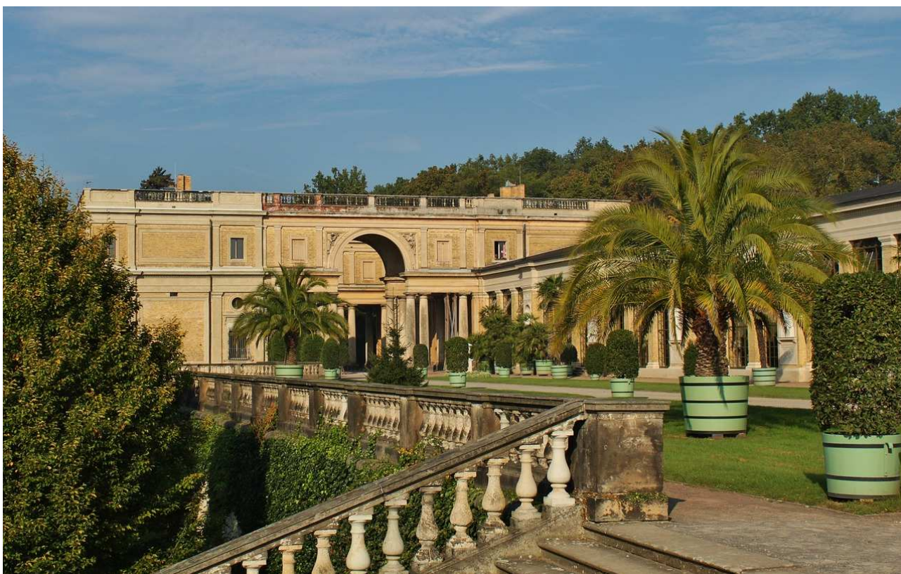
Il palazzo denominato Orangerieschloss nel parco di Sanssouci a Potsdam

Anche la Germania figura nell’elenco dei luoghi dove gli aranci amari, presenti fin dal XVI secolo, ricreavano nei giardini rinascimentali dei fastosi castelli o nei chiostri dei conventi un po’ del paesaggio agrumato del Mediterraneo. Ad esempio, nel Sud del Paese, nei Lander del Baden-Württemberg e della Baviera, si conservano ancora nella loro bellezza il “Giardino dei melangoli” ai piedi del Castello di Leonberg, l’arancera del giardino del Castello di Weikersheim e quella del giardino di Würzburg. Più a Nord, nel Brandeburgo, nei parchi di Berlino e Potsdam, oggi tra i beni patrimonio mondiale dell’umanità , terrazze di viti, arancere e orti con le specie mediterranee mantengono inalterato il fascino del “Giardino siciliano”, come era anche chiamata una sezione del parco di Sanssouci a Potsdam .