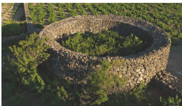
La peculiare struttura del "giardino pantesco"

Per questo gli agrumeti sono realtà di straordinaria valenza architettonica e paesaggistica , che contraddistinguono il territorio nazionale a più scale, dal Sud al Nord. Molti di questi paesaggi agrumicoli tradizionali si sono mantenuti, ma i più sono andati incontro a un graduale abbandono, in quanto situati in aree divenute marginali.