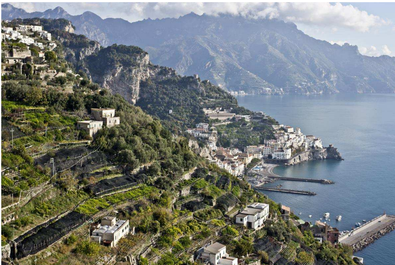
Il paesaggio della Costiera amalfitana con le tipiche limonaie

Salendo lungo la penisola, di straordinario valore architettonico e paesaggistico è un altro paesaggio rurale storico in Campania, quello terrazzato di limoni e cedri della Costiera amalfitana , il cui carattere di unicità ha consentito il suo inserimento nella lista dei siti Unesco patrimonio dell'umanità. A essere sottoposto alla tutela, in realtà, è l'insieme definito dal complesso paesaggio antropico sviluppatosi lungo le asperità morfologiche di un territorio di elevatissima diversità ambientale e biologica, con i borghi dalle tipiche architetture, le formazioni naturali di flora mediterranea (mirto, lentisco e, più in alto, querce e castagni), le aree a pascolo, i coltivi di agrumi, olivi, viti e ortaggi, le mulattiere, che insieme disegnano uno degli esempi più eclatanti di paesaggio mediterraneo.