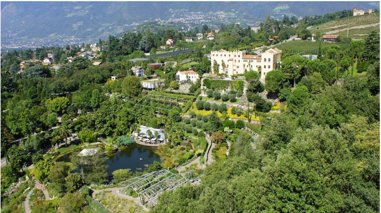
Un'ampia visuale dei giardini di Castel Trauttmansdorff

Sono così sorti svariati giardini "moderni". Ad esempio quelli di Castel Trauttmansdorff , inaugurati a Merano (Alto Adige) nel 2001 dopo anni di lavori, hanno riservato una cura particolare agli agrumi: piante di limoni, aranci, mandarini, pompelmi, kumquat e molte altre specie piantate in piena terra, in un'area detta "limonaia", accrescono la suggestione di questo luogo con il profumo dei loro fiori.