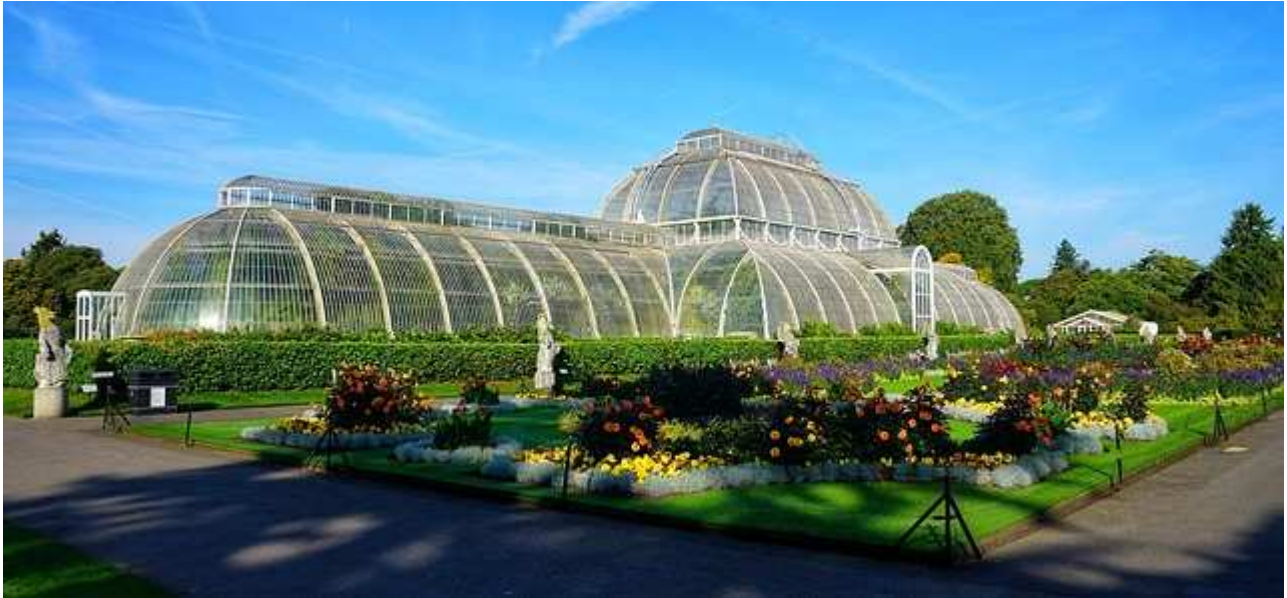
La serra dei Giardini Botanici Kew a Londra

Innumerevoli altre preziose realtà di piccole o grandi orangeries diversamente conservate e dedite alla loro funzione originaria sono disseminate in tutto il Nord Europa, dall' Inghilterra con la serra temperata del Kew Royal Botanic Gardens di Londra (1859) al Belgio col giardino barocco del Castello di Freÿr , lungo il fiume Mosa, con vasche e parterre e una orangerie tra le più antiche del Paese, che ancora si fregia di una collezione di agrumi tricentenari in vaso, curati meticolosamente ed esposti al clima esterno per soli pochi giorni all'anno.