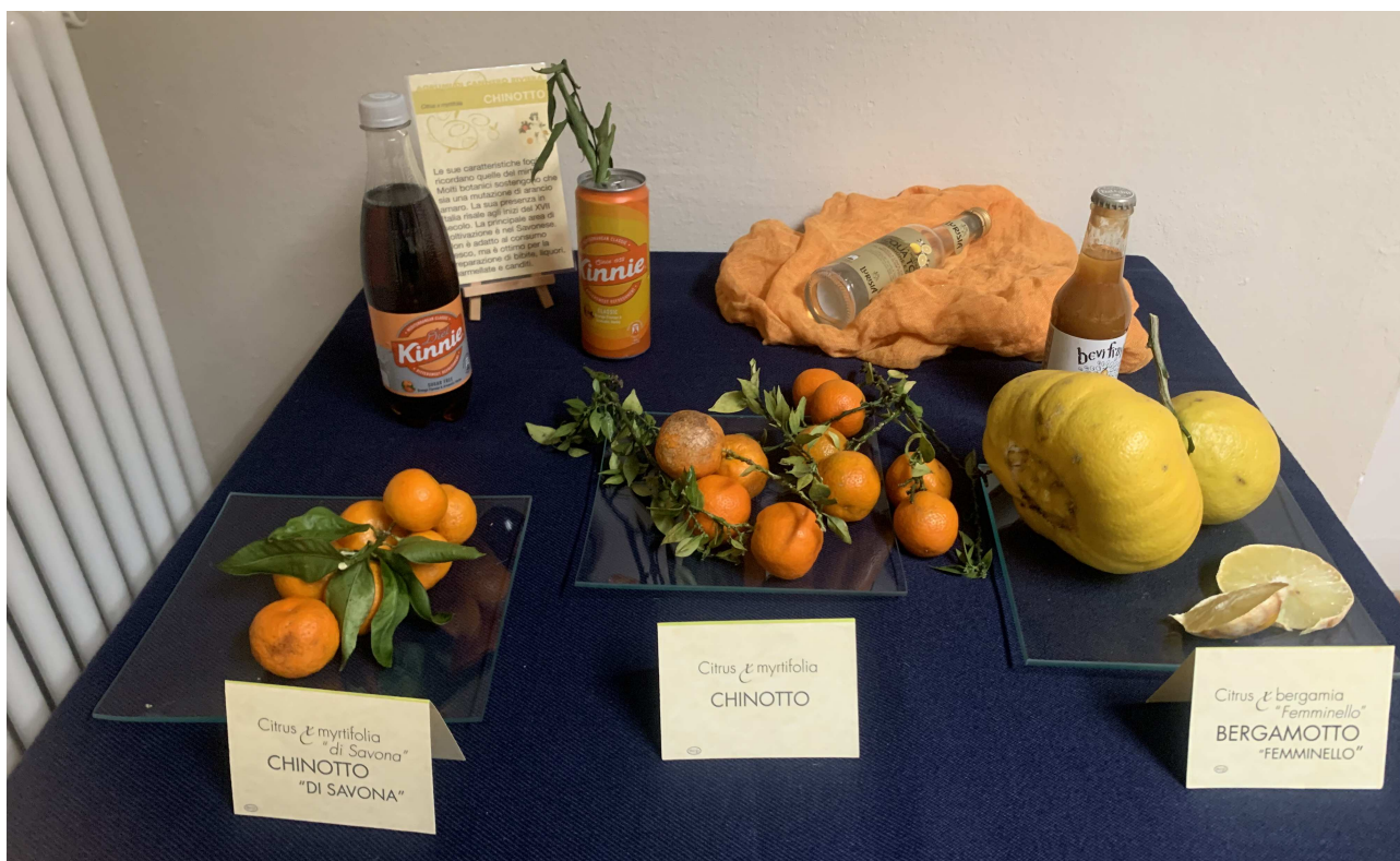
Chinotto e bergamotto alla mostra pomologica di Cannero Riviera

Si dovette attendere il 1949 per l'affermazione di un vero prodotto trasformato tutto italiano, con la nascita della formula della bibita Chinotto , ottenuta dai frutti di Citrus myrtifolia , la cui ambizione era rappresentare l'alternativa alle bevande globalizzate.