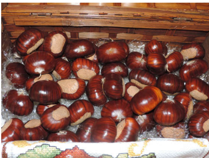
Un cestino di marroni, caratterizzati da particolare dolcezza e croccantezza

Le varietà che producono i più preziosi "marroni", richiestissimi dall'industria dolciaria, presentano frutti diversi, internamente non settati perciò facili da lavorare in pasticceria. Sono stati ottenuti con accurate selezioni e innesti che hanno portato in Italia all'identificazione e tutela di alcune varietà particolarmente pregiate, tra cui ad esempio il Marrone di Marradi in Toscana e quelli di Chiusa Pesio e della Valsusa in Piemonte.