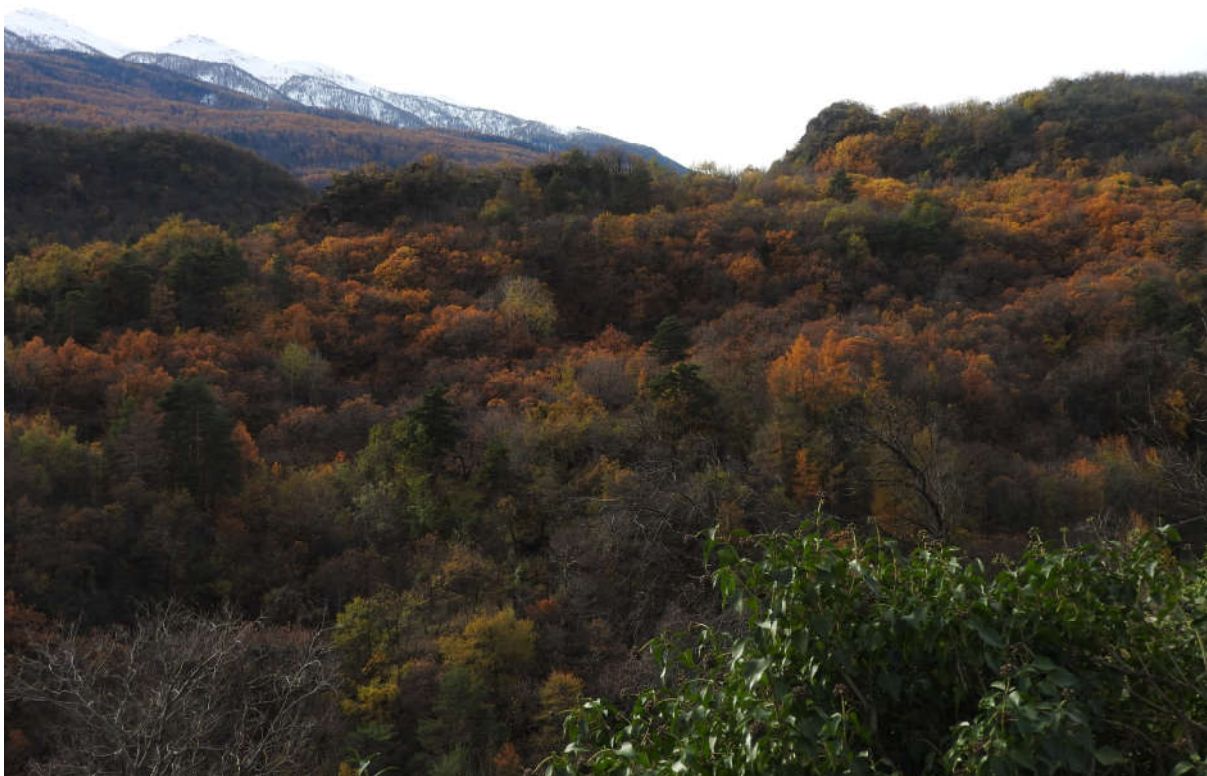
I castagni caratterizzano i boschi autunnali, accendendoli di colori vivaci

Questa importanza è data dalla massiccia sostituzione operata dall'uomo con il castagno fin dall'antichità, a discapito degli originari boschi di faggio e querceti di rovere.