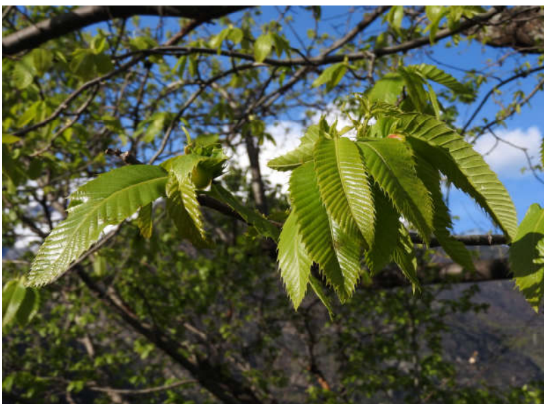
Foglie giovani di castagno

Anche le foglie , come i frutti, sono dotate di proprietà medicinali astringenti e batteriostatiche. Il decotto era un rimedio contro gli spasmi della tosse convulsiva come la pertosse, e nelle malattie da raffreddamento come espettorante, nonché calmante nei disturbi del sistema nervoso.