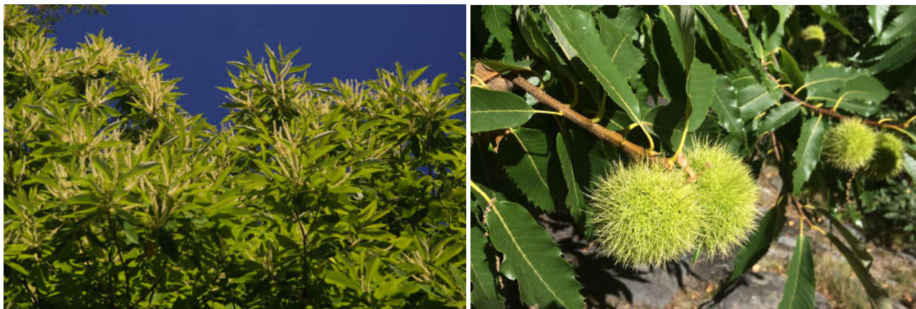
Castagno in fiore e ricci

È contraddistinto dalle inconfondibili lunghe foglie di colore verde brillante, lanceolate e seghettate, ma pure dalla fioritura che tra giugno e luglio lo ricopre di lunghi amenti bianchi, riuniti in mazzi simili a piccoli fuochi d'artificio, nonché dagli spinosi ricci verdebruni, originati dalla trasformazione della cupola verde che ricopre e racchiude le infiorescenze femminili che, fecondate, daranno origine in autunno alle castagne, frutti e semi insieme.